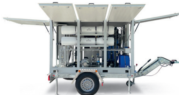
SOLUZIONI SU RIMORCHIO TRAILER SOLUTIONS SOLUTIONS DE REMORQUE

L'équipement peut être préparé pour des événements imprévisibles afin d'aider les organisations locales, nationales et internationales à se prémunir contre les catastrophes liées à l'eau et à l'assainissement dans leur région.