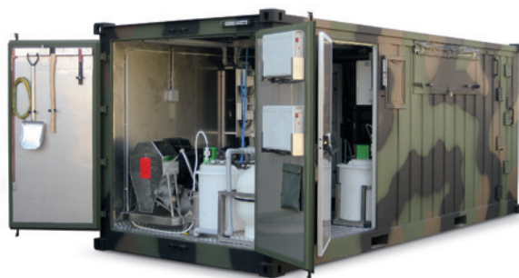
SOLUZIONI SHELTER SHELTER SOLUTIONS SOLUTIONS SHELTER

La gamme de produits est prête à fournir des équipements d'intervention d'urgence, notamment des stations de traitement de l'eau potable, des réservoirs d'eau, des équipements de désinfection et des produits chimiques, ainsi que des kits de drainage, directement à partir de nos entrepôts.