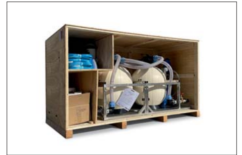
Unità mobile portatile / Portable mobile solution