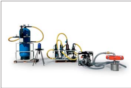
Recupero post emergency / Post emergency recovery

Mobile and trailer-mounted units for freshwater from river, well or brackish, sea mounted on detachable trailer, ready to use in Plug & Play mode. Available according to request with dual media filtration units with sand and activated carbon, complete with dosing and accessories, or reverse osmosis for brackish or sea water, complete with dosing and membrane flushing system, up to ultrafiltration and nanofiltration for domestic, micro-community and recreational use, with the opportunity to customise colours and liveries.