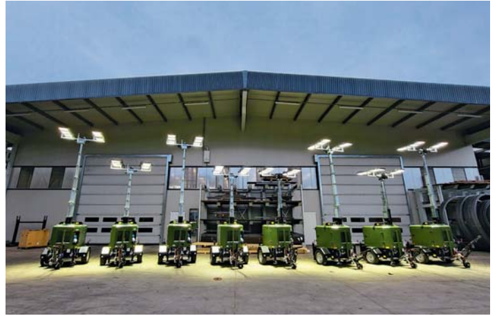
Ministero della Difesa, Esercito TERRARM. Army, Ministry of Defense.