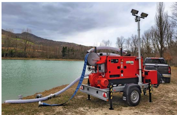
Protezioni Civili straniere. Foreign Civil Protection.