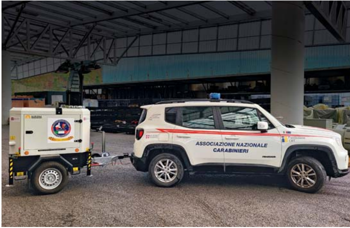
ANC Associazione Nazionale Carabinieri. National Association of Italian Police.