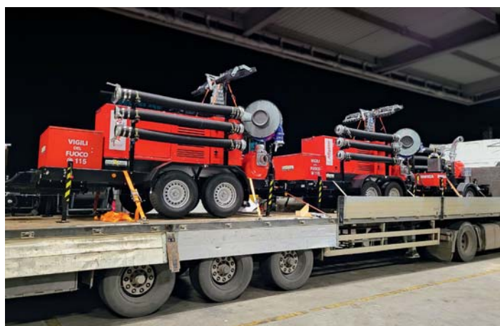
Direzione Regionale dei Vigili del Fuoco. Regional direction of Fire Brigades.