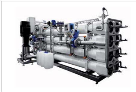
Osmosi inversa / Reverse osmosis