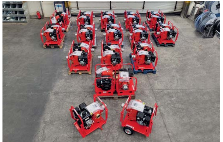
ANPAS Misericordie ANVFC. National Association of Assistance and Civil Protection.