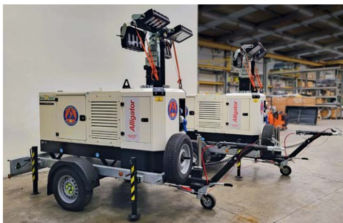
Dipartimento Nazionale di Protezione Civile. National Department of Civil Protection.