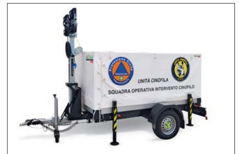
Rimorchi personalizzabili / Customize trailers