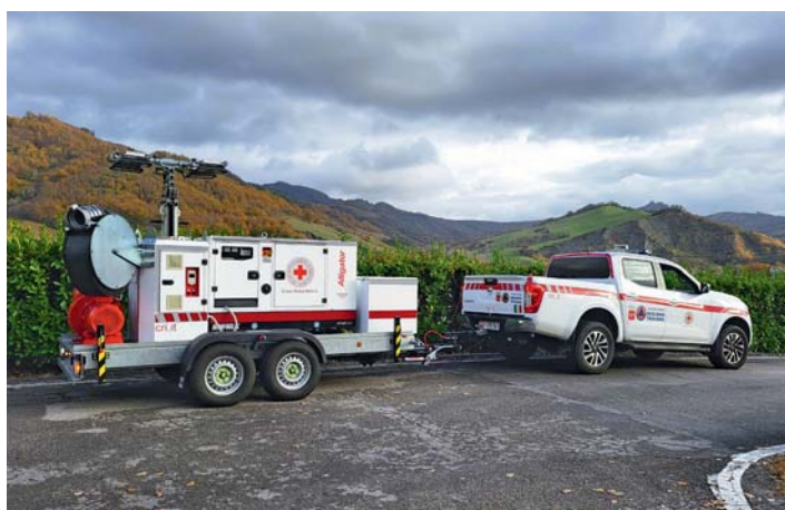
Croce Rossa Regionale. Regional department Red Cross.