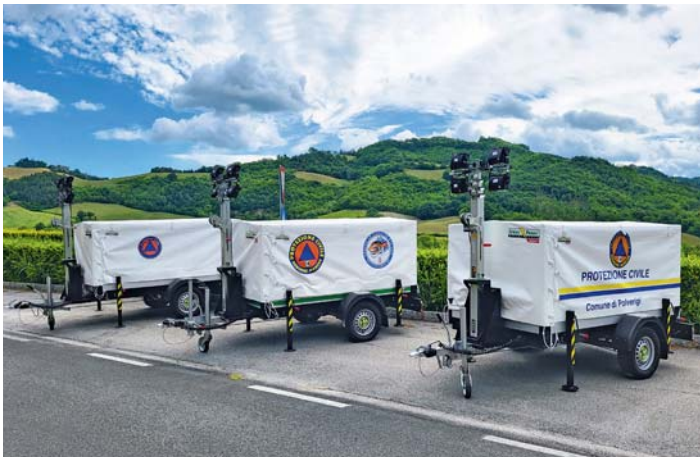
Gruppi di Protezione Civile. Association Civil Protection.