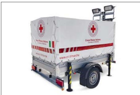
Rimorchi per tende pneumatiche / Pneumatic tents trailers

Homologated road trailers made to measure or specifically requested by groups, associations or organisations, from 750 kg to larger sizes also by Fire Brigades or IRC. Equipped for hydrogeological risk with the possibility of customisation: complete with 4 stabilising jacks, customisable tarp with VVF, CRI or Municipal Group or Association livery, openable on 4 sides and removable. Equipped with motor pump for emergency use, steel light tower H. 6 m, submersible electric pump solids handlings, submersible electric pump residue dewatering to 1 mm, gasoline inverter generator, and accessories for suction/delivery of motor pump and electric pumps according to required standards UNI, STORZ, SPHERICAL COUPLING etc