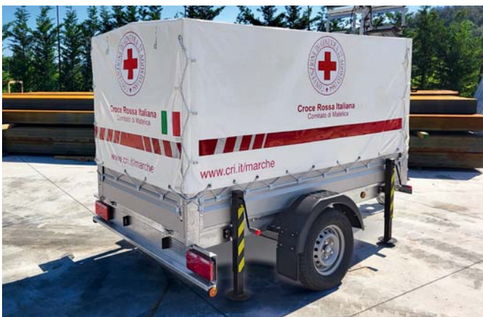
Croce Rossa Italiana. Italian Red Cross.