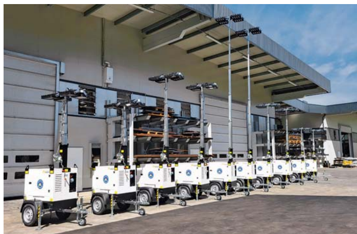
Dipartimenti Regionali di Protezione Civile. Regional department of Civil Protection.