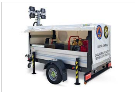
Rimorchi idrogeologici / Hydrogeological trailers