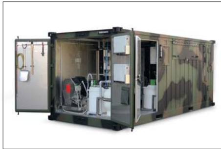
Impianti di potabilizzazione / Drinking water plant