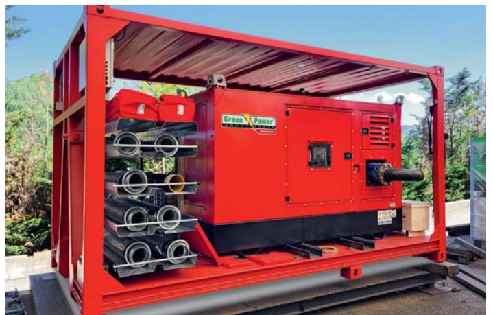
Ministero dell'Interno, Vigili del Fuoco. Ministry of interior, Fire Brigade.