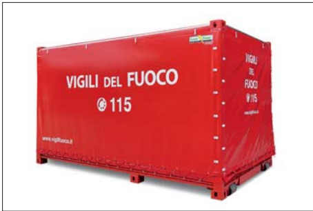
Moduli alta capacità / High capacity modules

HIGH CAPACITY PUMPING (HCP) systems and special set-ups, drinking water plants or generating sets on trailers or ISO modules with roll-off system or equipped with hydraulic pistons complete with hoses kits for long stretches with dedicated signage and accessories, interconnection fittings, UNI, STORZ, spherical, flutes for branching and wastewater distribution.