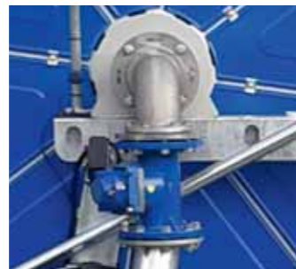
Contaltri meccanico Mechanic water meter Compte-litres mécanique