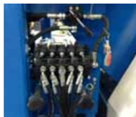
Comandi movimentazione idraulici Hydraulic movements control Contrôle hydraulique des mouvements