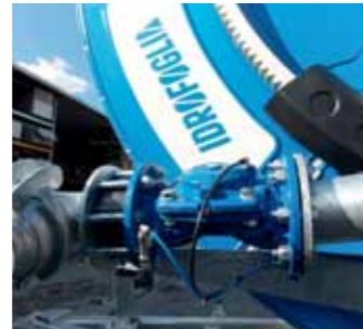
Idrovalvola di ingresso Hydraulic inlet valve Vanne hydraulique à l'entrée