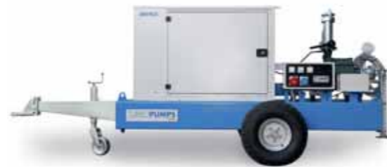
Turbopump con motore insonorizzato specifica per pivot Turbopump with soundproof engine for pivot application Turbopump avec insonorisation moteur spécifique pour le pivot