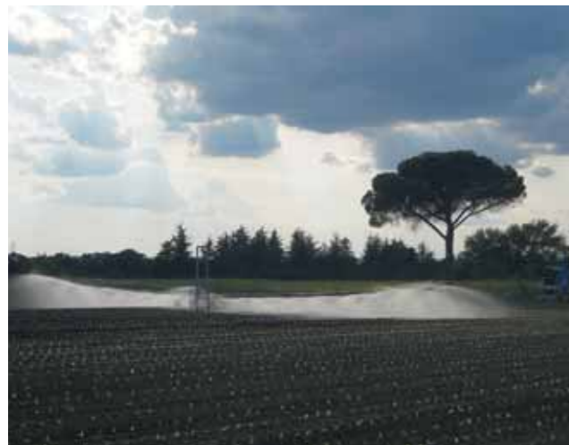
Ala piovana con struttura "a traliccio" standard Spraying boom with standard "trellis" structure Rampe d'arrosage avec structure "à treillis" standard