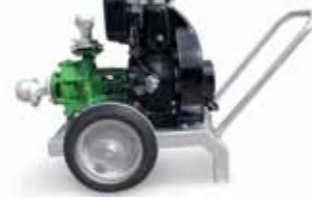
Turbopump monocilindrica Single-cylinder Turbopump Turbopump monocylindrique

Idrofoglia c'est le leader mondial dans le projet et la production de motopompes pour l'agriculture et systèmes de traitement de l'eau. Avec une gamme de puissance de 5 à 800 kW, une vaste disponibilité de pompes et moteurs de première qualité et une capacité constructive affirmée, nous sommes capables de satisfaire toutes les exigences du marché.