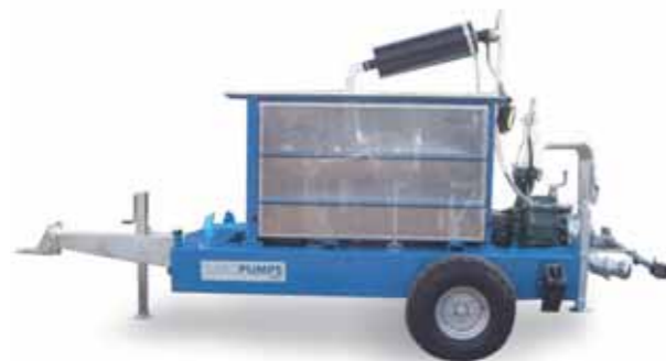
Turbopump con tetto e rete di protezione Turbopump with roof and net-guard protection Turbopump avec toit et grille de protection