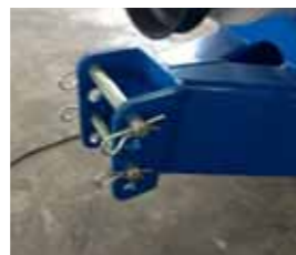
Occhione smontabile e regolabile Removable and adjustable tow-eye Tête d'attelage réglable et amovible