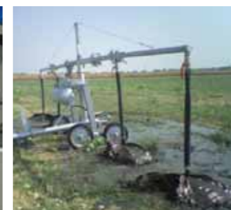
Ala piovana per acque cariche Boom for waste water Rampe pour eaux chargés