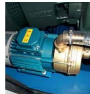
Elettropompa di adescamento Electric priming vacuum pump Pompe auto-aspirant électrique