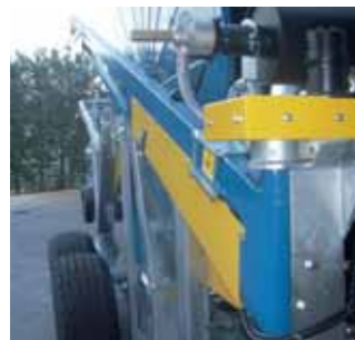
Bandiera idraulica Hydraulic arm-holder Bras hydraulique