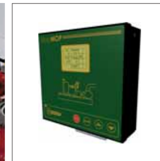
Centralina EasyMOP EasyMOP control panel Boîte EasyMOP