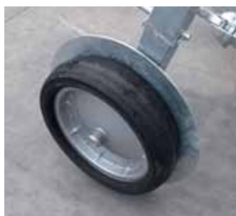
Dischi direzionali per carrello Directional disks Disques directionnelles