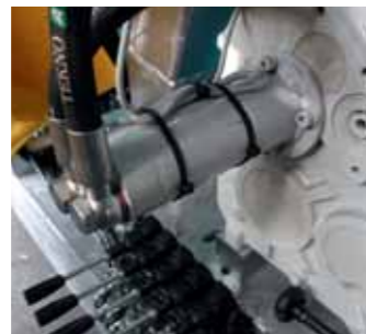
Kit raccolta idraulica per motore ausiliari Hydraulic rewinding kit with auxiliary engine Kit enroulement hydraulique avec moteur auxiliaire