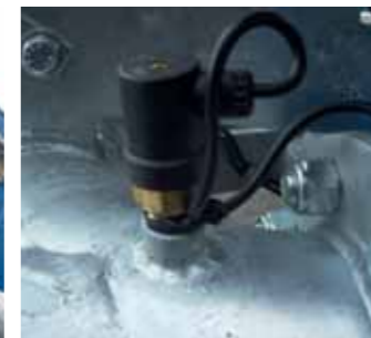
Pressostato per computer Computer pressure switch Pressostat pour boîte électronique