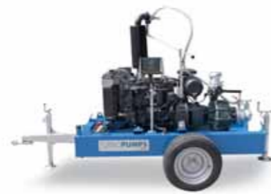
Turbopump standard Standard Turbopump Turbopump standard