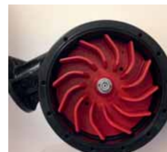
Turbina verniciata in Plascoat Turbine PLASCOAT painting Turbine peinte avec PLASCOAT