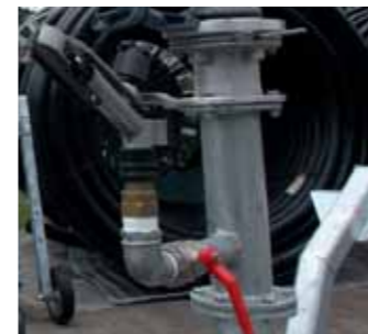
Kit secondo irrigatore sul carrello Second sprinkler on the trolley Deuxieme canon sur chariot