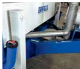
Doppio piedino, doppio rabbocco Double staker leg, double filling point Double béquille, double goulotte de remplissage