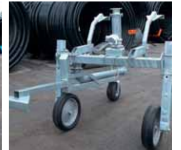
Carrello decentrato Off-set trolley Chariot décentralisé