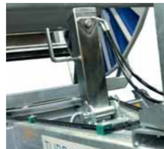
Piedino idraulico pieghevole Foldable hydraulic draw-bar jack Béquille au timon hydraulique et pliable