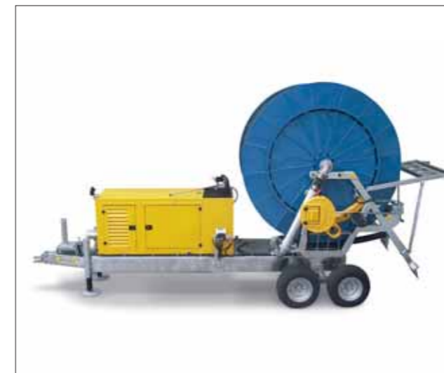
Combo girevole con motopompa insonorizzata longitudinale Turntable Combo with soundproof longitudinal motor pump Combo tournante avec motopompe insonorisée longitudinale