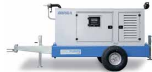
Motopompe totalmente insonorizzate Full-silent Turbopump Turbopump avec insonorisation complète