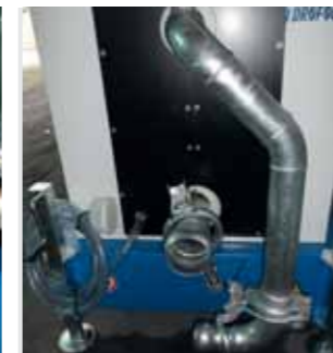
Collo di cigno fisso Fixed swan neck Col de cygne fixe