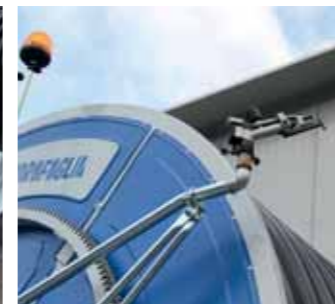
Kit secondo irrigatore sul telaio Second sprinkler on the machine frame Deuxieme canon sur châssis