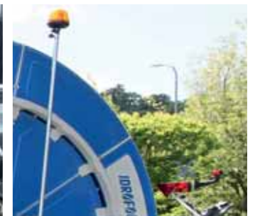
Omologazione stradale Road type-approval Homologation routière