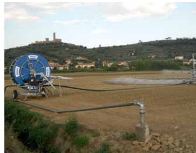
Turbocar con Ala piovana pieghevole Turbocar with folding Spraying boom Turbocar avec Rampe d'arrosage pliable