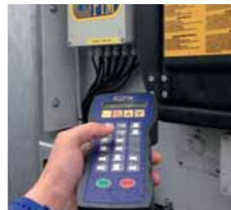
Radiocomando per impianto idraulico Radio control Radiocommande