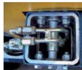
Pistoni per staffe posteriori nel telaio Stabilizers driven by hydraulic pistons placed inside frame. Cylindres hydrauliques pour les bèches d'appui, installés dans le châssis.