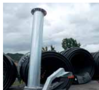
Prolunga per irrigatore Sprinkler extension Rallonge au canon