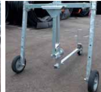
Carrello tipo mais a basse pressioni Corn sprinkler for low pressures Chariot maïs pour basse pression