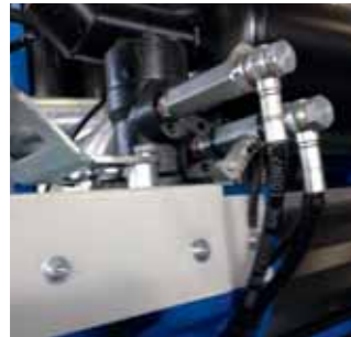
Bandiera autofrenante Self-bracking arm Freinage automatique pour le bras