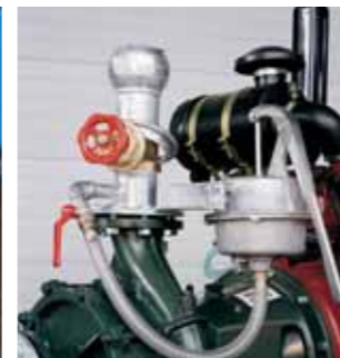
Pompa di adescamento manuale Manual self-priming pump Pompe d'amorçage manuelle