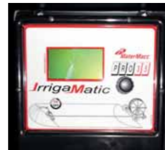
Computer gestione irrigazione Computer Boîte