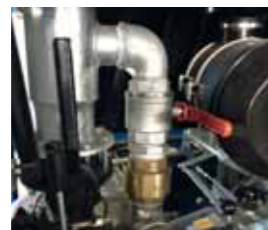
Scarico del compressore Compressor discharge Décharge du compresseur