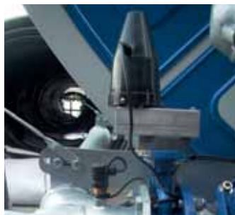
Elettrovalvola di chiusura lenta Slow closing electric valve Vanne électrique à fermeture lente