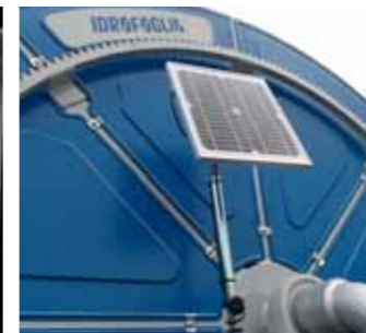
Pannello solare per computer Solar panel for computer Panneau solaire pour boîte