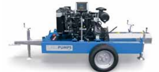
Motofrizione Motor clutch Motofriction