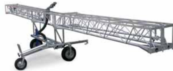
Ala piovana con struttura "a traliccio" pieghevole Spraying boom with folding "trellis" structure Rampe d'arrosage avec structure "à treillis" pliable

Rampes d'arrosage. A compléter notre gamme de produits, comme alternative très valide aux machines à longue portée, on peut offrir rampes d'arrosage pour cultures qui ont besoin d'une différente nébulisation d'eau.