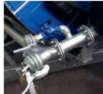
Idrovalvola di scarico Hydraulic outlet valve Vanne hydraulique de décharge