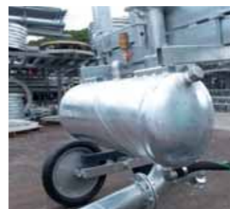
Seratoio idrozavorante per carrello Water-ballasting tank for trolley Ballastage du chariot avec reservoir eau