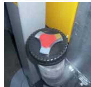
Tappo con chiave Tank-cap with key Bouchon avec clef