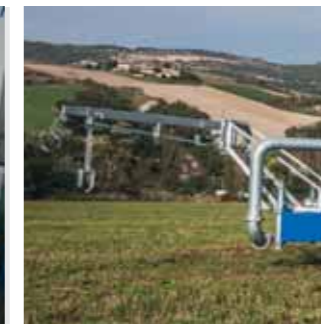
Bandiera porta aspirazione Arm-holder to lift up the suction pipe Bras pour soulever le tuyau d'aspiration