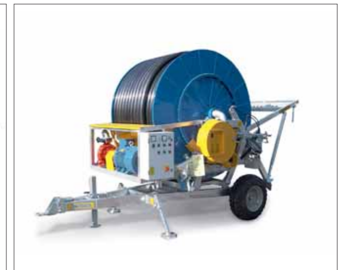
Combo girevole con elettropompa Turntable Combo with electric pump Combo tournante avec motopompe électro pump