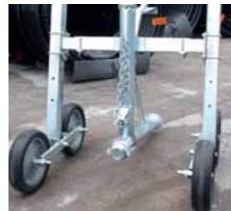
Carrello a 4 ruote Four wheels trolley Chariot à quatre roues