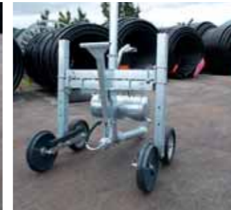
Carrello HP con ruote in ghisa HP trolley with cast iron wheels Chariot HP avec roues en fonte