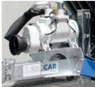
Compressore per svuotamento tubo PE Hose emptying compressor Compresseur pour le vidage du tuyau