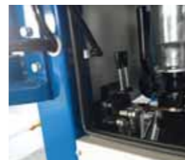
Leva di comando bandiera Control lever for suction arm Lever de contrôle pour le bras porte-tuyau d'aspiration