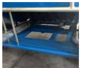
Telaio maggiorato e più robusto Bigger and stronger chassis Châssis majoré et renforcé