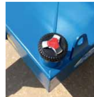
Tappo serbatoio con chiave Tank cap with key Bouchon réservoir avec clef