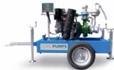
Turbopump due cilindri Two cylinders Turbopump Turbopump à deux cylindres