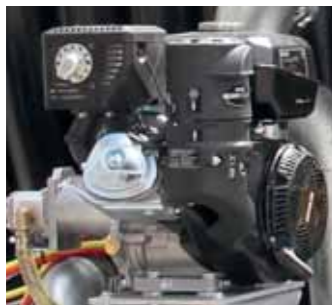
Motore ausiliario Auxiliary engine Moteur auxiliaire