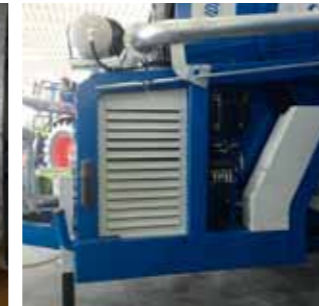
Tetto con tre pannelli Roof and sheet protection on 3 sides Toit avec protection en tôle sur 3 côtés