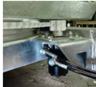
Rotazione idraulica Hydraulic rotation Rotation hydraulique