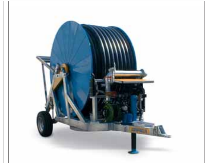
Motopompa rilancio pressione Booster motor pump Motopompe pour relancer la pression