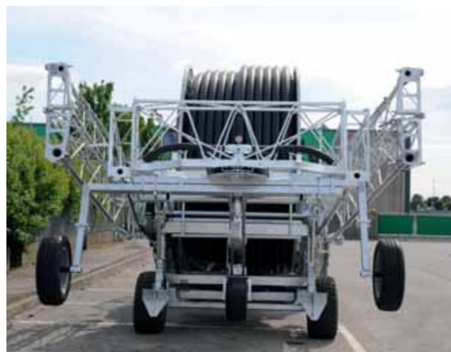
Turbocar con Ala piovana standard Turbocar with standard Spraying boom Turbocar avec Rampe d'arrosage standard