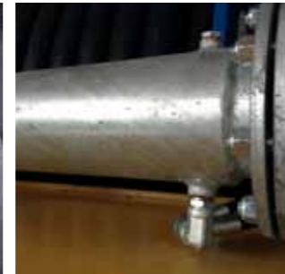
Raffreddamento olio per raccolta idraulica Oil-cooling system for hydraulic winding Système refroidissement huile pour enroulement hydraulique