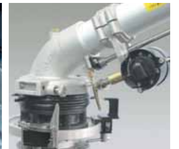
Rotorkit multiangles per irrigatore Rotorkit multiangles Rotorkit multi-angle