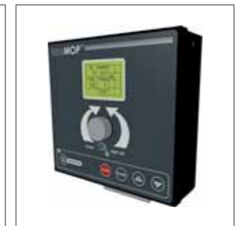
Centralina IdroMOP IdroMOP control panel Boîte IdroMOP