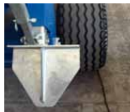
Vanghe posteriori rinforzate Reinforced anchorage rear plate Bèches d'ancrage postérieures renforcées