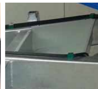
Vano portaoggetti su telaio Objects holder compartment Panier porte outils