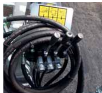
Distributore con tubi ed innesti rapidi Distributor with fast clutch hoses Distributeur avec tuyaux à embrayage rapide