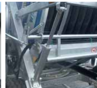
Carica carrello con pistoni idraulici Trolley lifting with hydraulic cylinders Chargement du chariot avec cylindres hydrauliques