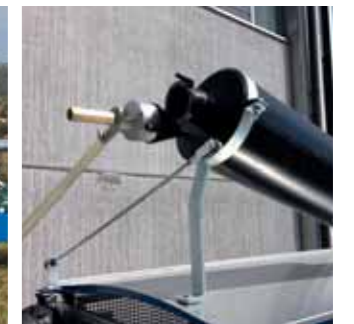
Disp. adescamento in depressione Self-priming device vacuum operated Dispositif auto-aspirant en dépression