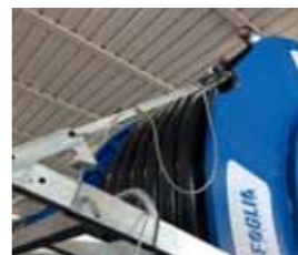
Barra luci pieghevole per omologazione Foldable light-bar for road-type approval Barre-feux pliable pour l'homologation routière