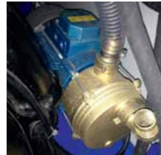
Pompa elettrica per adescamento Self-priming electric pump Electropompe d'amorçage