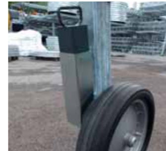
Zavorre in ferro per carrello Iron ballasts kit for trolley Jeu de masses en acier