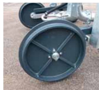
Ruote in ghisa per carrello Cast iron wheels Roues en fonte