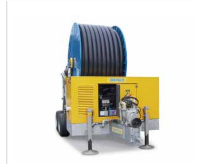
Combo con motopompa insonorizzata su str. IG1 Combo with soundproof motor pump on IG1 Combo avec motopompe insonorisée sur IG1